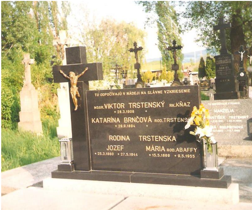
Monsignor je pochovaný na cintoríne v Trstenej.