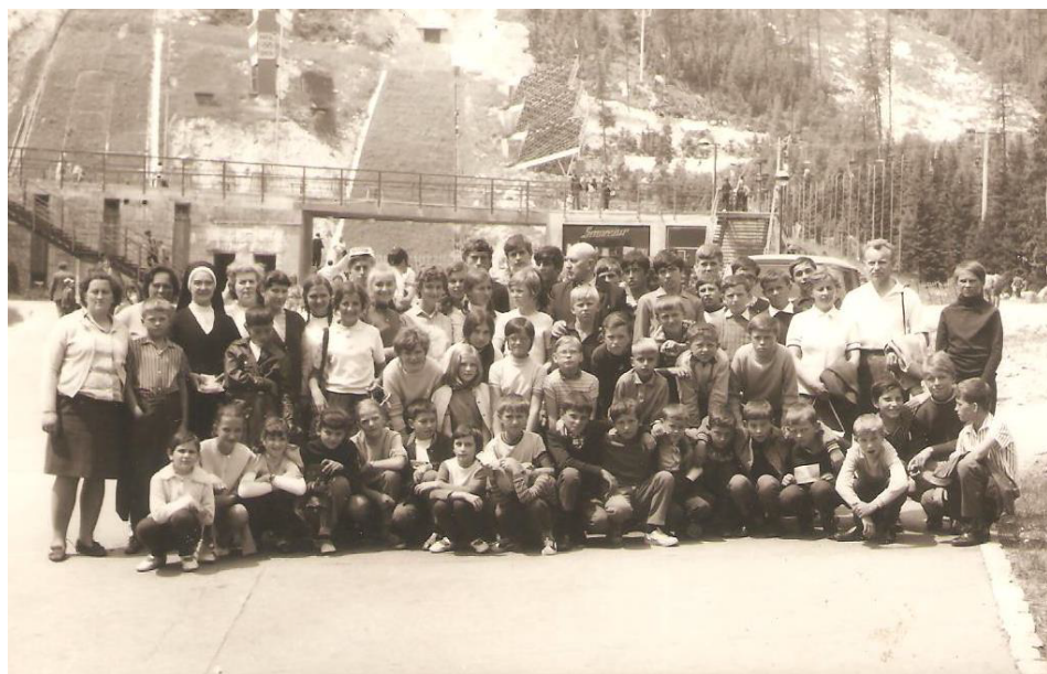
Mládež zo Starej Ľubovne spolu s monsignorom na výlete na Štrbskom Plese.