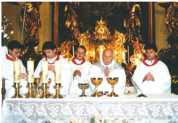
Prvé stretnutie rodákov - kňazov, rehoľníkov a rehoľných sestier zo Starej Ľubovne spolu s monsignorom.