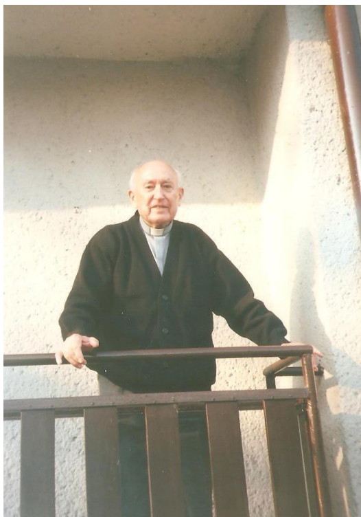
Takto, z balkóna svojho domu v Trstenej, sa vždy lúčil so všetkými, ktorí ho prišli navštíviť.