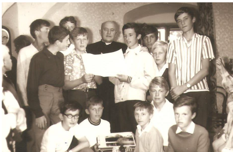
Miništranti so svojim "monsiňorom" pri stretnutí na fare.