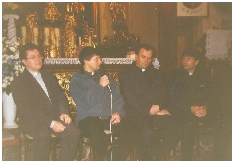
Beseda s kňazmi, rodákmi zo Starej Ľubovne. Beseda sa uskutočnila počas tretieho stretnutia kňazov a rehoľných sestier v kostole sv. Mikuláša v Starej Ľubovni, dňa 23. 11. 2000.