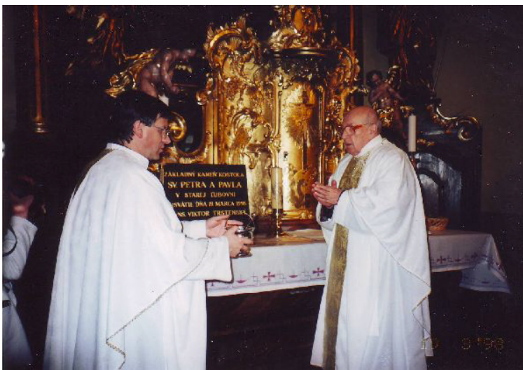
Posviacka základného kameňa pre nový kostol sv. Petra a Pavla. Monsignor posvätil základný kameň 19. 3. 1998 v kostole sv. Mikuláša.