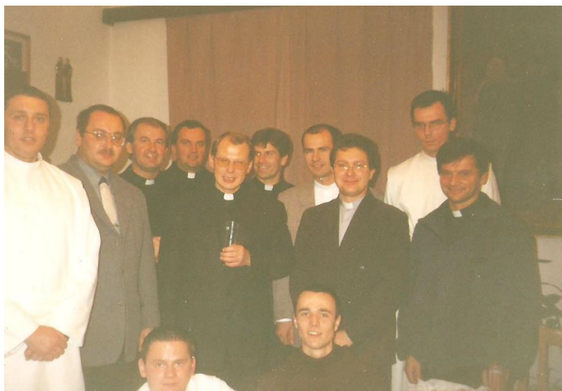
Tretie stretnutie rodákov- kňazov, rehoľníkov rehoľných sestier, 23. 11. 2000, spoločná fotografia na fare.