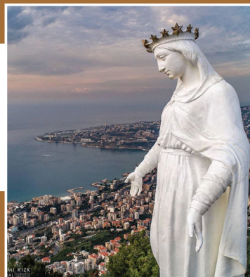
Naša Pani z Libanonu Harissa

21.9. Brezno - Mazorníkovo, 22.9. Čerín, 23.9. Čerín, 24.9. Mikušovce, 25.9. Bánovce nad Bebravou, 26.9. Lúčky, 29.9. B. Bystrica - Fončorda, 30.9. Lučenec, 1.10. Zvolen - Sekiér