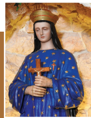
Zázračná Panna Mária z Bešvetu