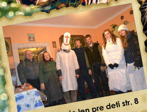
Mikuláš nie len pre deti str. 8