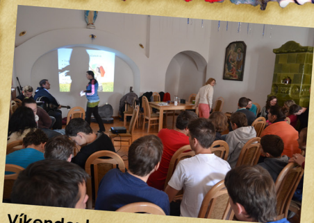
Víkendovka spoločenstva Emanuel str. 10