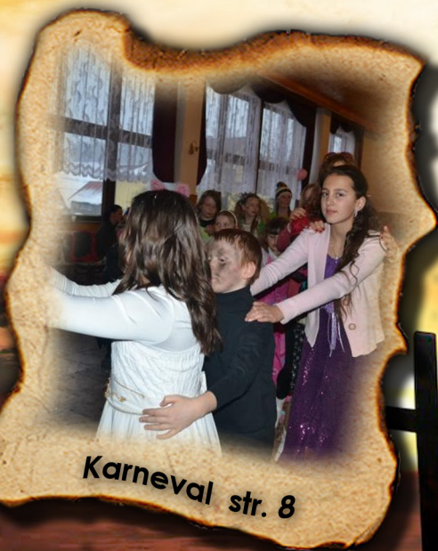
Karneval str. 8