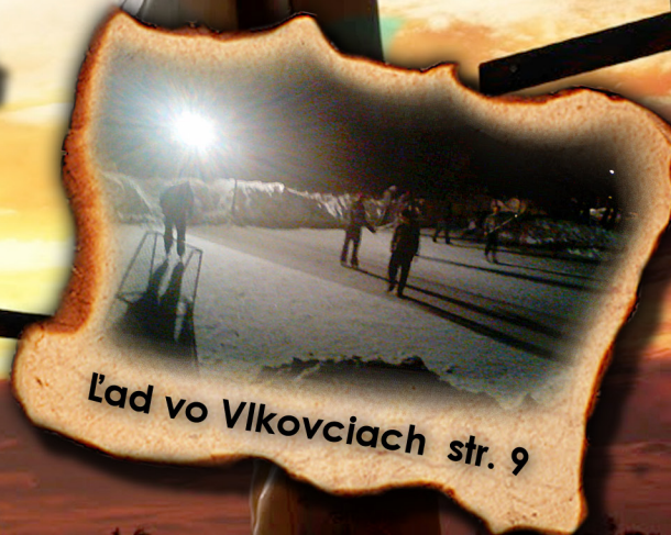
Ľad vo Vlkovciach str. 9