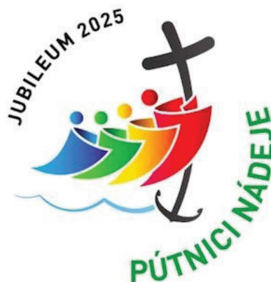
Logo jubilejného roka 2025

K získaniu jubilejných milostí nie je nevyhnutná návšteva Ríma, ale bude ich možné získať aj na viacerých miestach našej diecézy, o čom budeme včas informovaní. Snažme sa teda čo najlepšie využiť vzácny čas, ktorý je pred nami.